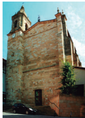
Santa Eufemia eliza