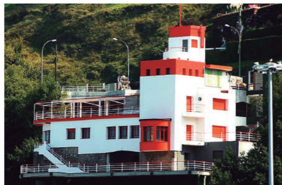
Ikuspegi Gaztelutik (Kikunbera etxea)