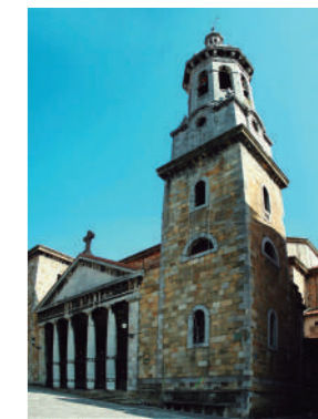
Santa Maria eliza