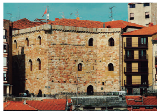
Ertzilla Dorrea / Arrantzaleen Museoa