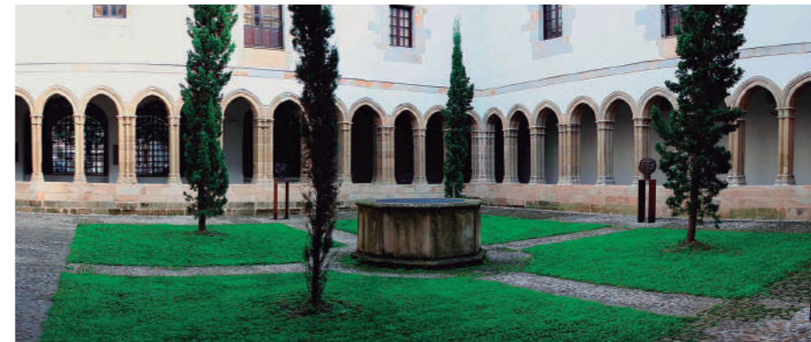
Frantziskotarren eliza eta klaustroa

Bermeoko armariak hainbat informazio eskaintzen digu: