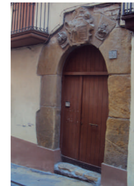
Doniene kaleko etxeak